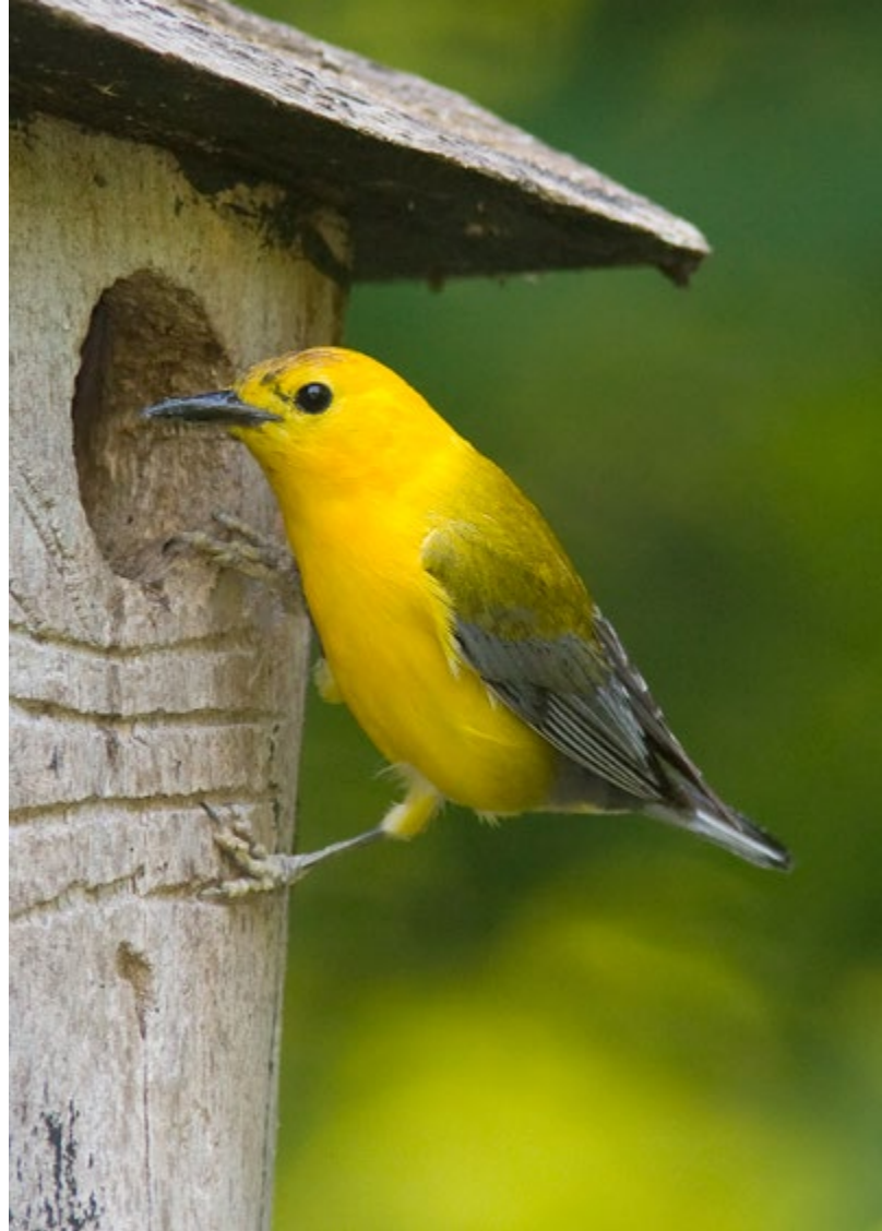
Prothonotary Warbler/Paruline orangée

Monitoring Network. He worked tirelessly to advance grassland bird conservation and the understanding and protection of Species at Risk – especially the Prothonotary Warbler, Bobolink, and Eastern Meadowlark – across Ontario and Canada. Jon also wrote the seminal Breeding Birds of Long Point, Lake Erie , co-authored the groundbreaking Norfolk County Natural Areas Inventory , and played a key role in executing the first and second editions of the Atlas of Breeding Birds of Ontario . To name just a couple more examples, Jon sat on the federal Committee on the Status of Endangered Wildlife in Canada, chairing its Birds subcommittee for several years, and was a key player in developing the initial training materials for bird banders across North America.