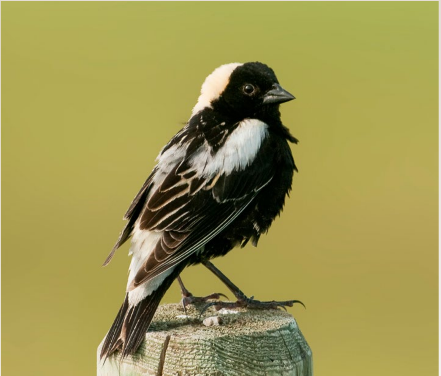
Goglu des prés/Bobolink

mentor de premier plan pour de nombreux observateurs et bagueurs d'oiseaux, ornithologues et naturalistes en devenir. Il possédait une incroyable capacité de faire confiance et de fournir des possibilités aux jeunes espoirs. Et il faisait preuve d'une patience sans fin, surtout sur le terrain, qu'il instillait à ceux qui le côtoyaient. Parmi les messages adressés à Jon par ceux qu'il a encadrés, un commentaire ressort : « merci de m'avoir donné une chance! »