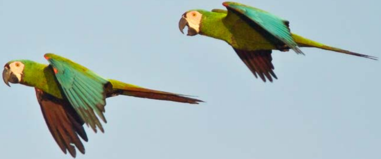
Chestnut-fronted Macaws/Ara vert