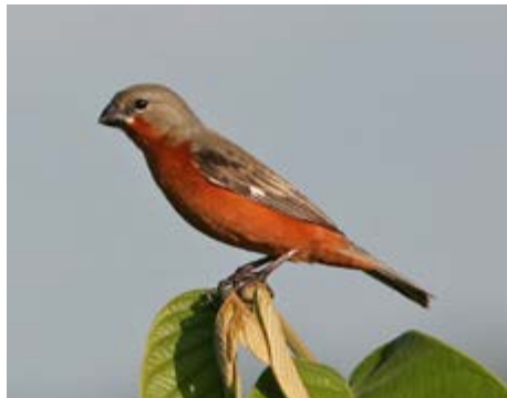
Ruddy-breasted Seedeater/Sporophila petit-louis

A resident of Vancouver, BC was fined $7500 in summer 2012 for violating a ban on all pet bird imports from China (where avian influenza is considered endemic). On April 13, 2012, a trained border dog at Vancouver International Airport smelled something suspicious in the carry-on luggage of Kwok Sing Lee, who was