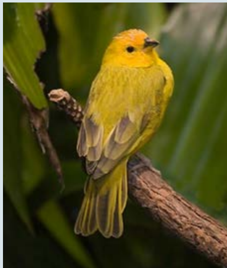
Sicale bouton-d'or/Saffron Finch

paru en août 2012, le commerce illicite d'oiseaux capturés dans la nature peut être très lucratif. La valeur sur le marché noir de certaines espèces peut se chiffrer à des dizaines de milliers de dollars. Dans son article, l'auteur signale que, lorsque les contrebandiers sont découverts, ils ont parfois des œufs et de petits oiseaux dissimulés dans leurs vêtements ou tassés dans des tubes de médicaments. Les oiseaux aux couleurs attrayantes ou aux chants mélodieux courent le plus de risques. Les perroquets sont les plus prisés, ce qui explique en partie pourquoi le tiers