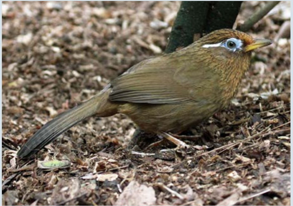
Garrulaxe hoamy/Melodius Laughing-Thrush

Selon l'article d'Abby McBride du Laboratoire d'ornithologie de Cornell