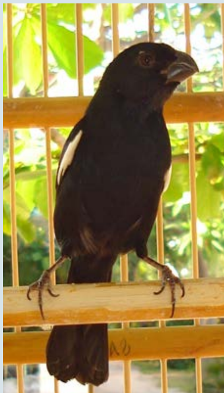
Père noir négrito/Cuban Bullfinch

D'avril à juin 2012, Interpol a intercepté plus de 8 700 oiseaux et autres spécimens d'espèces fauniques et a arrêté près de 4 000 personnes au cours de l'opération « Cage » qui visait