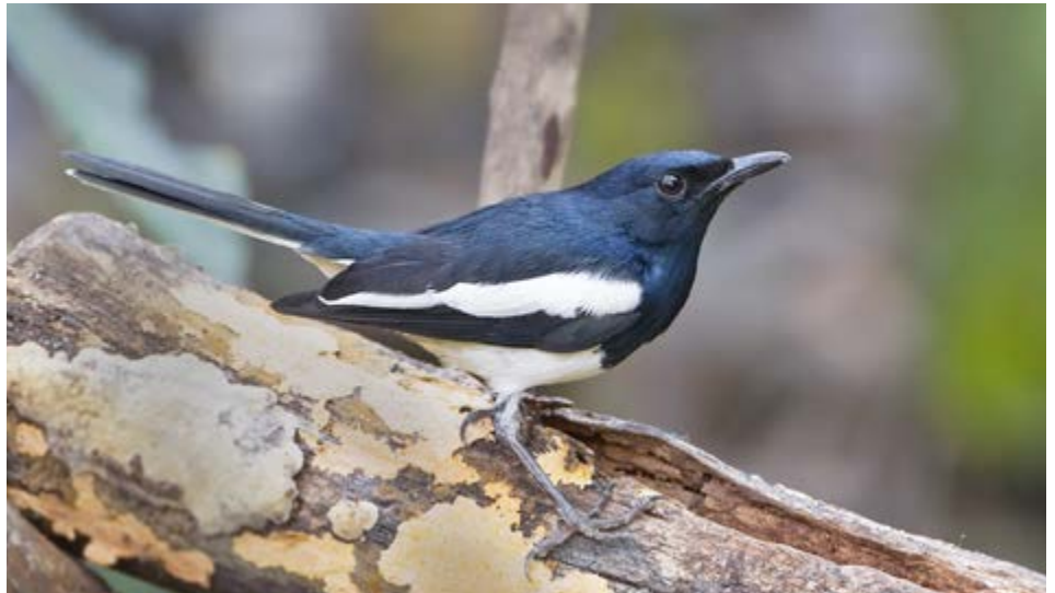
Oriental Magpie-Robin/Shama dayal

In one of the most notorious bird smuggling cases in recent Canadian history, Flikkema Aviaries of Fenwick, Ontario was responsible for illegally importing thousands of tropical birds into Canada, and then illegally exporting them to buyers across the United States. A 17-month investigation by Environment Canada and the U.S. Fish and Wildlife Service revealed that between December 1997 and October 1999, the Flikkema family illegally exported 3882 tropical finches valued at